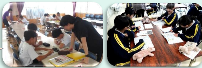
家庭学習ウィーク中の学習会の様子