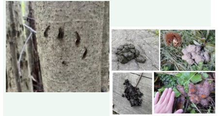
食べたもの：（上段左から）黒っぽい、クマ （下段左から）サクランボの葉、カキ 「美の国あきたネット ツキノワグマ情報」より