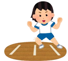
種目別体力テスト結果

全学年・男女別で、全国平均と同等か上回っている結果となりました。特に、3年男子のシャトルラン・ソフトボール投げ、5年女子の上体起こし・反復横跳び・シャトルラン・50m走は、全国平均を有意に上回る結果が出ました。週3回実施している「ぐんぐんタイム」でのマラソン練習や体づくり運動に、全校で取り組んでいる成果が表れています。