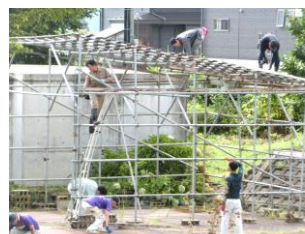
あっせつくん小屋解体