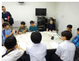
図書委員会サミット