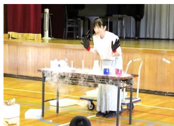
始業式(わくわく実験)