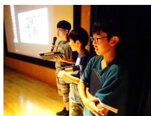
図書委員会サミット