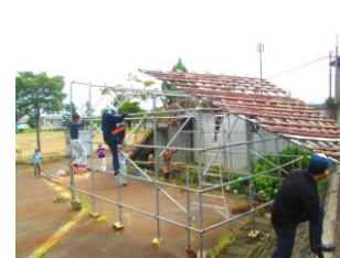
あっせつくん小屋解体