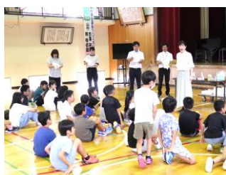
全員でわくわく実験