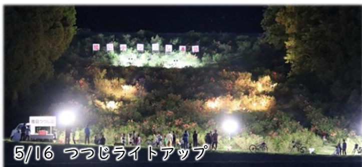
5/16 つつじライトアップ