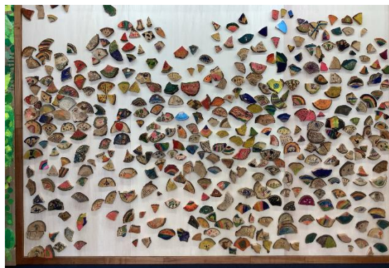
児童玄関壁面のモニュメント

4月から、馬場小出身としての誇りをもち、水沢小の子ども達と元気に、仲良く活動していくことを願っています。