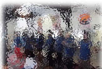
13日(木)アルペンスキー教室(スキーボランティアの皆様とともに)