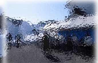
16日(日)雪まつり/リコーダー部発表

十日町雪まつりが、15日(土)、16日(日)開催されました。今年は雪の量も多く、各地に作成された雪像は、どれも力作ぞろいでした。そんな中、越後水沢駅前広場での雪像は、「十日町市長賞」受賞ということで、大変おめでとうございます。前日、子どもたちの雪像づくりに参加した際、水沢地区の雪像を作成している場面に遭遇し、その迫力に圧倒されました。良き伝統文化であると改めて感じました。