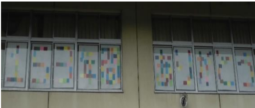
児童作「153年間ありがとう」図書室窓

11月3日(日)に実施される「閉校記念式典」の日も近づいてきました。これまで実行委員の皆様を中心とした準備活動が滞りなく行われました。運営に当たられた地域、保護者の皆様には、改めて心より感謝申し上げます。当日までの日々は、全校児童とともに最後の準備を行ってまいります。今後とも御協力の程、よろしく願いいたします。