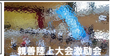
親善陸上大会激励会

学校における教育活動において、最も重要なことは児童の「安心・安全」です。これからも全校児童が思いっきり遊び、学び、協力して活動できる環境を教職員一同大切に考えていきます。そして、馬場小学校153年という重い歴史の最後の児童を、心を込めて指導、支援してまいります。