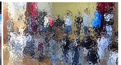
閉校記念式典児童発表練習