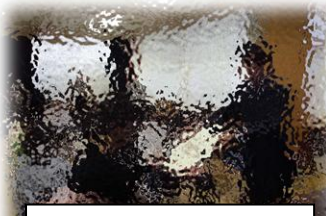
中越教育美術展表彰式