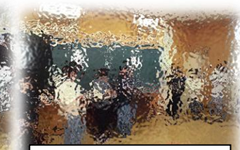
「いじめ」について考える

1月8日(水)に3学期始業式、14日(火)に全校朝会が行われました。始業式では中越教育美術展の表彰式、校長講話が行われました。校長講話では、馬場小学校では特別な意味をもつ3学期を、失敗を恐れず、何事にも「挑戦」してほしいという旨の話がありました。全校朝会では、1、3、5年生の児童代表より、3学期がんばりたいことについての発表がありました。それぞれ進級を控えている今、特に学習面をがんばりたいという発表でした。堂々とした発表態度が素晴らしいとともに、成長を感じさせる発表でした。その後、5、6年生から、現在社会問題となっている「いじめ」について全校で考える取組が行われました。劇を通じ、いじめは絶対してはいけない、許してはいけないことや、いじめとは何かを改めて考える場となりました。来年度への進学・進級を控え、とても意義のある取組でした。