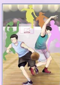
バスケットボール