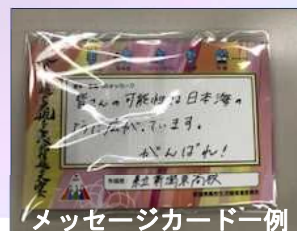
メッセージカード一例