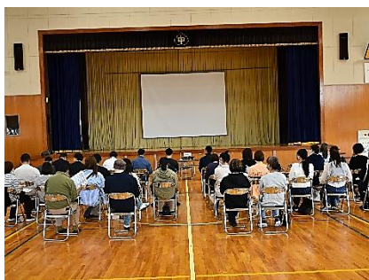
PTA総会では、本年度事業が全て承認されました。