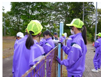
重量のあるフェンスをみんなで持ち上げて設置しました。

春の環境整備作業を４月３０日（木）に実施しました。２月以降の気温上昇で積雪が早くに解消されたこともあり、整備作業を円滑に進めていくことができました。転落や侵入防止用フェンスの設置、水はけをよくするための側溝の泥上げや落ち葉拾い、鑑島方面生徒が利用する階段清掃等がありましたが、限られた時間の中で生徒が互いに協力し、分担しながら効率よく作業を進めていました。生徒の皆さんの力添えで今年度も吉田中学校の校地全体が気持ちのよい環境になったと思ひます。一生懸命取り組んでくれた皆さんにあらためて感謝の気持ちを伝えたいと思ひます。