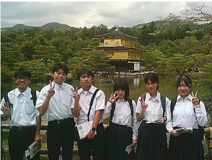
金閣寺では、金の輝きに感動しました。

2日目は、旅行で一番楽しみにしていた行事の班別研修に臨みました。教科書や資料等で調べた有名な神社仏閣等を実際に訪れ、直接目にすることで新たな気づきや発見を得ることができました。