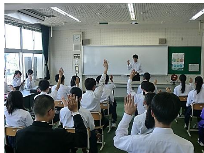
提案を全会一致で承認されるなど実りある総会でした。

５月１３日（水）に生徒総会を実施しました。伝統ある吉田中学校の生徒会活動をさらに充実させ、継続していくために全員で真剣に考えたところです。会長の公約を踏まえ、吉田中学校のよさである生徒同士の距離の近さを生かし、交流行事を積極的に進めるといふ提案に対して、全会一致で承認されました。今後は、活動を工夫していきながらよりよい学校生活の充実と向上を目指して一人ひとりが積極的に生徒会活動に取り組んでもらえたらと思ひます。そして、今年度の生徒会活動が、１つでも多くの成果を残してくれることに期待しています。