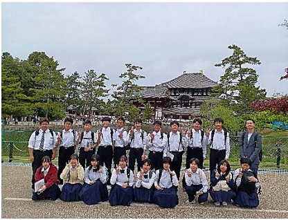
奈良公園では、全員で記念撮影に臨みました。

1日目は、早朝に吉田中学校を出発し、北陸方面を經由して奈良県に向かいました。到着後は奈良公園、東大寺、興福寺周辺等を訪れ、その後は京都駅周辺に移動し、学びを深めました。