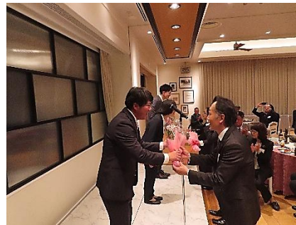
PTAから転出教職員に感謝の花束を贈呈しました。