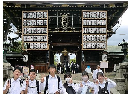
北野天満宮では学問成就を願ってきました。