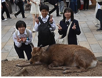
奈良公園の鹿とは、様々な場面で交流を深めました。