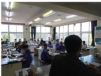
３年生理科では、生徒が進んで学ぶ様子が印象的でした。

４月２５日（土）に学習参観及びPTA総会、歓送迎会が行われました。当日は、保護者の皆様から多数ご来校いただいたことに感謝申し上げます。学習参観では、子どもたちの学ぶ姿を間近でご覧いただくことで、成長を実感できたことと思います。その後は、PTA主催によるPTA総会と歓送迎会がそれぞれあり、歓送迎会では地域の皆様からも多数ご出席いただき、終了間際まで転出入教職員と交流を深めていきました。皆様からの学校に寄せられる願いや思いを受け止めながら教育活動の充実に引き続き、取り組んでいきたいと思ひます。