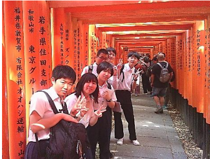
伏見稲荷大社では、どこまでも続く鳥居に驚きました。