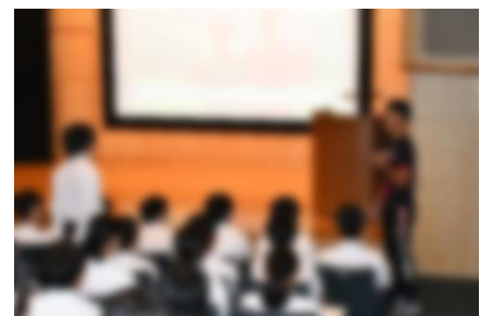
講演後、講師に質問している様子

10月4日（金）、PTA研修イベント委員会主催の今回の講演会は、服部勇馬様を講師にお迎えし、十日町情報館で開催されました。2020年の東京オリンピックに出場された服部様ですが、今回の講演では、長距離選手としての進路選択や苦労されたことなどを中心にお話しいただきました。また、講演会の前後には当校に立ち寄り、生徒とともに給食を食べたり体を動かしたりしていただきました。生徒にとって心に残る一日になりました。