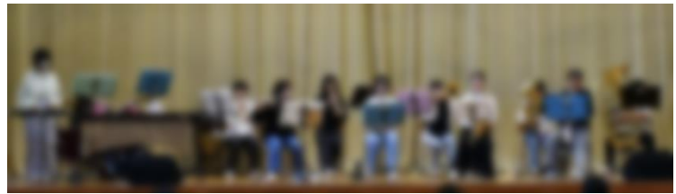
吹奏楽部のステージ

地域の皆様を中心に、昨年度を上回る多くの方々からご来場いただきました。生徒の活動が地域の活性化に少しでも貢献できたのであれば幸いです。