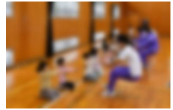
園児とともにトレーニング

10月9日(水)、当校の体育館を会場にして「ちびっ子たいそう教室 2024」が開催されました。これは、吉田地区青少年育成会の事業の一つとして、ネージュスポーツクラブの方のご指導の下、鑑島保育園と当校の3年生が交流しながらコーディネーショントレーニングを体験するというものです。状況に合わせて「体の動き」や「力の加減」を調整する能力を「コーディネーション能力」と呼びますが、遊びの要素を多く含んだ運動を幼い頃に体験することは、とても大切なことだと言われています。参加した当校の生徒にとっては、家庭科で学習する保育の内容につながるところも多く、楽しみながら貴重な体験ができました。