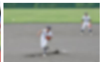
対水沢中・津南中合同チーム戦

10月2日（水）、第44回十日町市中魚沼郡中学校新人野球大会が開催されました。当校は川西中学校との合同チームとして、十日町総合公園野球場を会場にした試合でした。初戦のネクサスAチームとの対戦では、思った通りのゲーム展開ができずに惜敗しました。水沢中・津南中合同チームとの対戦は、途中、接戦となりましたが、勝利することができました。チーム結成後、一緒に練習してきた川西中学校の生徒と力を合わせ、最後まで諦めずに頑張り抜いていました。