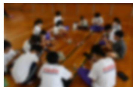
班で輪になって制作している様子

10月7日（月）、小・中合同「ちんころ作り体験活動」を行いました。これは吉田中学校区での小中一貫教育の事業の一つで、当校の体育館に3か校（吉田小、鑑島小、吉田中）の児童生徒が集まり、一緒に「ちんころ」を作るといいます。吉田公民館や地域の方々にも準備や指導でご協力いただき、一人一人が地域の伝統を体験することができました。また、この体験活動を通して、作り方を教え合ったり作った「ちんころ」を鑑賞したりすることで、児童生徒の関係が一段と深まりました。