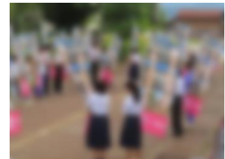
鏡島小学校での様子

6月3日（月）・10日（月）の2回にわたって、吉田地区小中合同あいさつ運動が行われました。1年生がそれぞれの母校（吉田小・鏡島小）に訪れ、玄関前で登校してくる小学生とあいさつを交わすというものです。生徒は、久しぶりに訪れる母校を懐かしく感じながら、元気に、優しく「おはようございます」と声を掛けていました。ご協力いただきました地域の皆様、誠にありがとうございました。