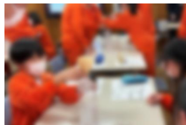
スポーツドリンク手作り体験の様子

1月16日（金）、十日町市スポーツ協会様の主催で、1・2年生を対象としたスポーツ栄養教室が行われました。講師として公認スポーツ栄養士の齊藤公二様をお迎えし、栄養に関する知識のほか、朝食や睡眠の大切さ、水分補給の仕方などについて講話をしていただきました。また、後半にはスポーツドリンクの手作り体験もさせていただき、楽しみながら栄養について学ぶことができました。