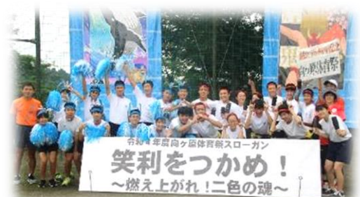
昨年度のパネルと3年生

当日は8:30から開会式を行って応援合戦・新保広大寺節発表、各種目と続き、11:55に閉会式の予定です。