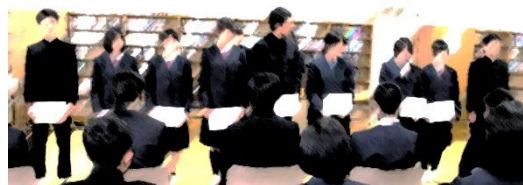
↑委嘱状をもち、挨拶をする新委員長